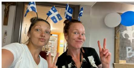
Dîner de la fête nationale Juin 2022