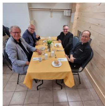
Brunch des partenaires et collaborateurs septembre 2022